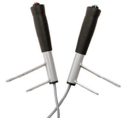
Håndtak med el kontroll