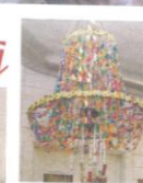
Barna laget en stor lyskone ut av et gammelt sykkelhjul.

Verdsette barns arbeid Barna laget egne malerier hvor de lagde lerret ut av pizzaesker som de surret gammel tapet rundt. I dette prosjektet har barna også lært litt om bruken av matematikk. Barna har regnet ut omkretsen av sykkelhjulet og telt hvor mange perler som skulle til. Barna har diskutert, hjulpet hverandre og har hatt mye samarbeid.