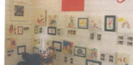
Malerier og tegninger om hvordan en lyskone kan se ut.

sykkelhjul. Barna fikk i oppgave å finne ut hva de kunne lage eller bruke sykkelhjulet til. Barna bestemte seg for at de ville lage en lyskone av den. De satte seg ned og brukte sin fantasi og tegnet ned på et ark hvordan en lyskone kunne se ut. Barna ville at en lyskone burde ha masse diamanter, perler og at den måtte skine. Ut fra barnas egne ideer ble lyskonen til med masse farger.